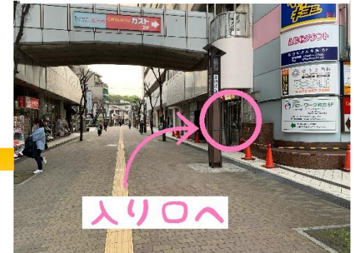
⑤ダイコクドラッグ前の入口へ