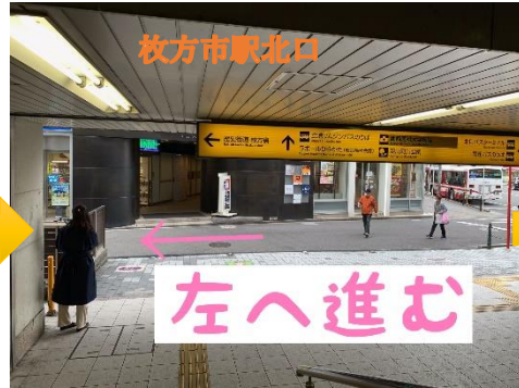
②階段を下りたら左へ進む