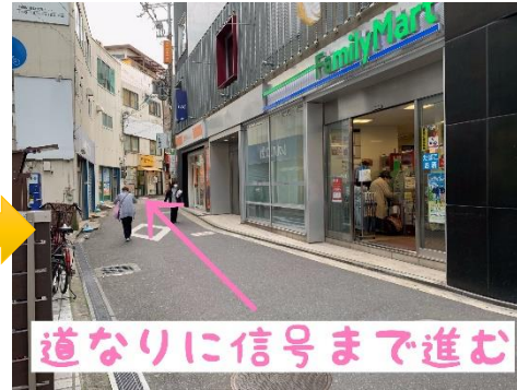
③道なりに信号まで進む