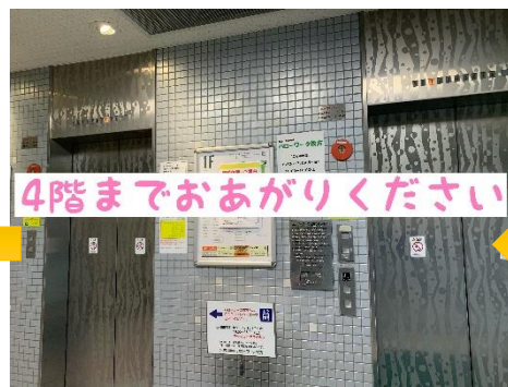
⑦右手にエレベーターホール