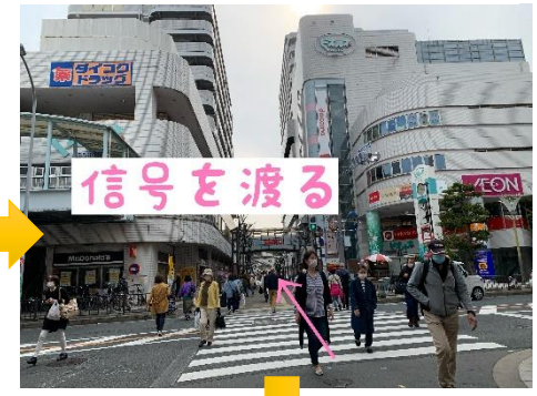
④信号を渡る (右手がビオルネ)