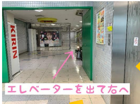
⑧エレベーターを降りて右へ進む