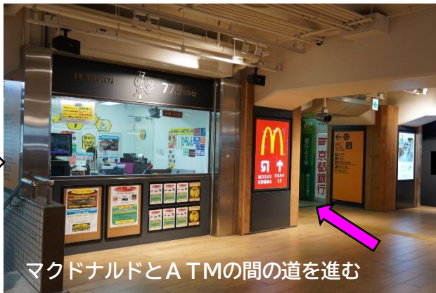
マクドナルドとATMの間の道を進む