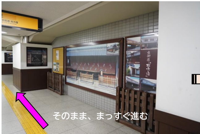
そのまま、まっすぐ進む