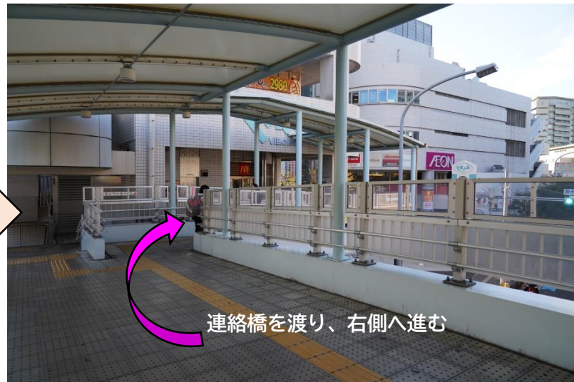
連絡橋を渡り、右側へ進む