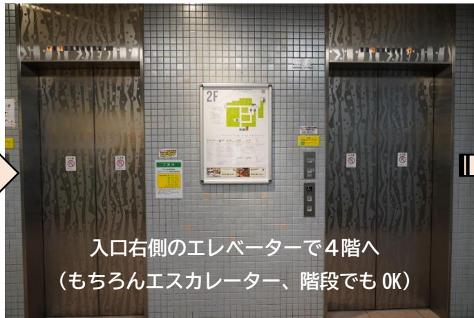
入口右側のエレベーターで4階へ (もちろんエスカレーター、階段でもOK)