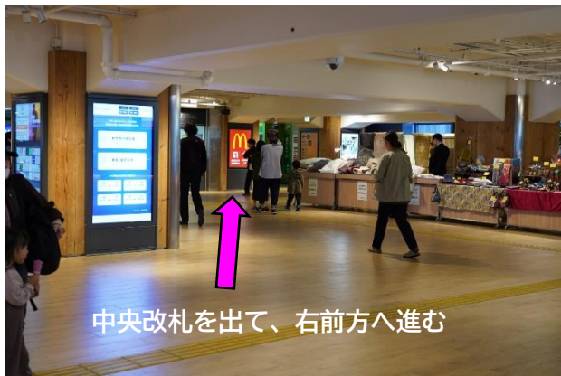
中央改札を出て、右前方へ進む